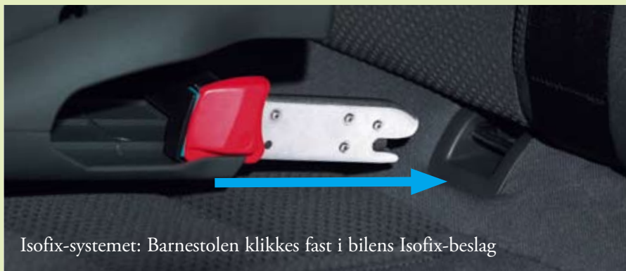
Isofix-systemet: Barnestolen klikkes fast i bilens Isofix-beslag

Isofix er et særligt system til fastspænding af barnestole. I stedet for at spænde barnestolen fast med bilens seler, er der to øjer svejset fast i bilen, som Isofix-barnestolens beslag kan gribe fat i. Det gør det let og enkelt at fastgøre især bagudvendte stole stabilt og undgå fejlmontering. Har din bil Isofix-beslag, anbefaler vi, at du anskaffer en Isofix-stol.